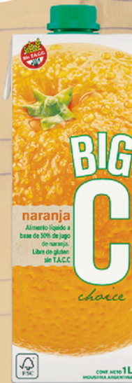
BIG C ALIM.LIQ. NARANJA X 1 LT. (12) COD. 34010