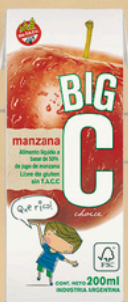
BIG C ALIM.LIQ. MANZANA X 200 CC.(18) COD. 34021