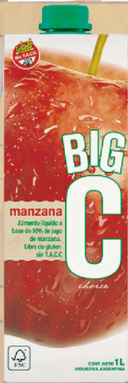
BIG C ALIM. LIQ.MANZANA X 1 LT. (12) COD. 34011