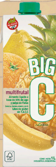
BIG C ALIM. LIQ. MULTIFRUTA X 1 LT. (12) COD. 34013