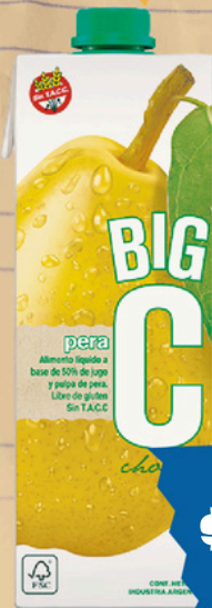
BIG C ALIM.LIQ. PERA X 1 LT.(12) COD. 34014