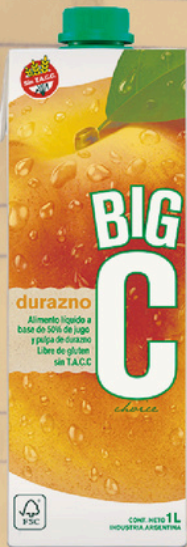
BIG C ALIM.LIQ. DURAZNO X 1 LT. (12) COD. 34012