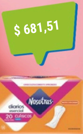
$ 681,51 NOSOTRAS PD ESENCIAL C/CALEND X20U (36) COD. 23220