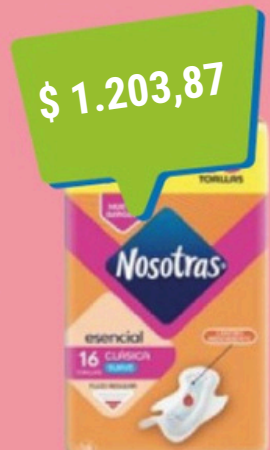
$ 1.203,87 NOSOTRAS TOALLAS CLASICAS .ESENC. BOB X 16U.(15) COD. 23113