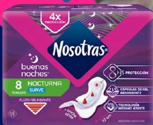
NOSOTRAS TOALLA BUENAS NOCHES X 8U (1622/1851)(24) Cod. 23152