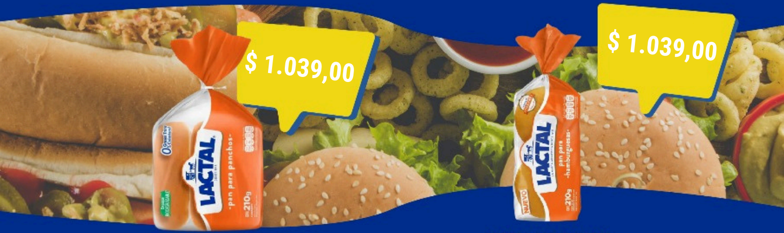
LACTAL PAN P/PANCH. X 210 GR.(16)(5879) Cod. 33343