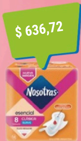
$ 636,72 NOSOTRAS TOALLAS CLASICAS .ESENC. BOB X 8U.(30) COD. 23112