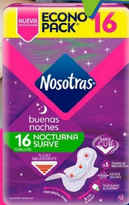
NOSOTRAS TOALLA BUENAS NOCHES TELA CURVMAX X 16 U.(12)(2292) Cod. 23161