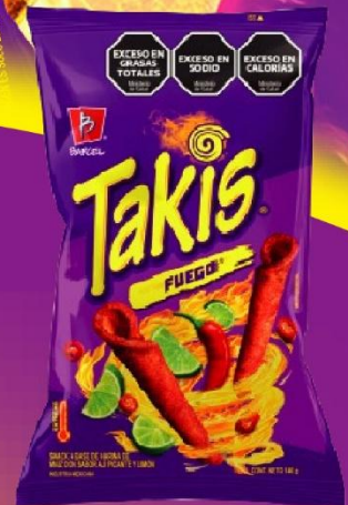
TAKIS FUEGO SNACK X 140GR.(16) COD. 33847