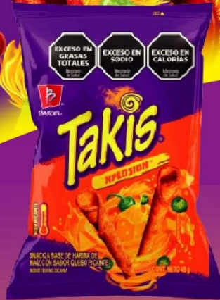
TAKIS XPLOSION SNACK X 49 GR(36) COD. 33842