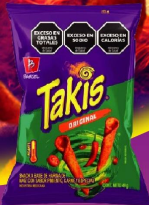
TAKIS ORIGINAL SNACK X 49GR.(36) COD. 33839