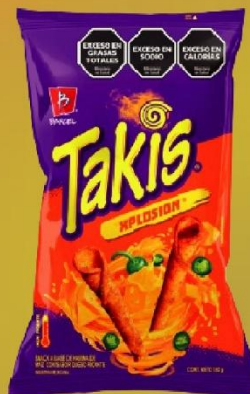
TAKIS XPLOSION SNACK X 140 GR(16) COD. 33844