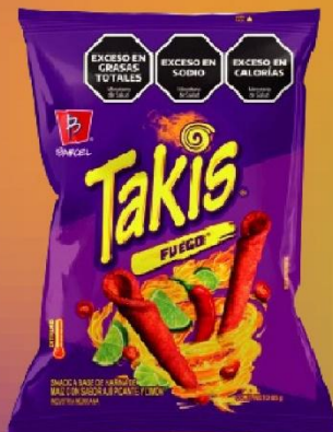
TAKIS FUEGO SNACK X 85 GR.(35) COD. 33846