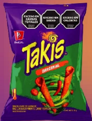
TAKIS ORIGINAL SNACK X 85 GR(35) COD. 33840